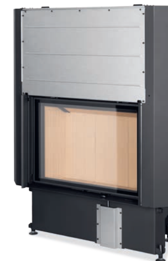
Impression 2G L 80.60.01