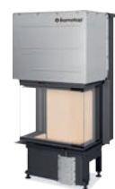
Impression C 2G L 6761.34.21