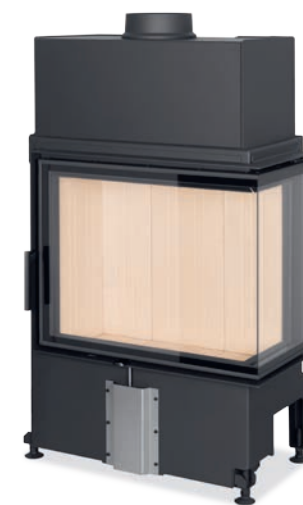
Impression R 2G S 71.60.34.21