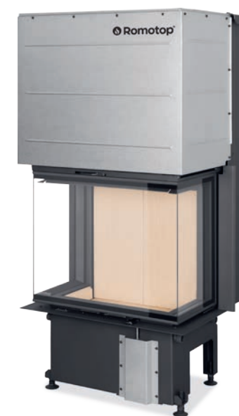
Impression C 2G L 67.61.34.21