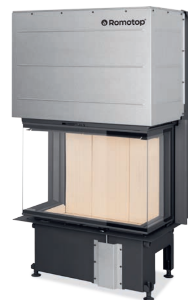
Impression C 2G L 80.61.34.21