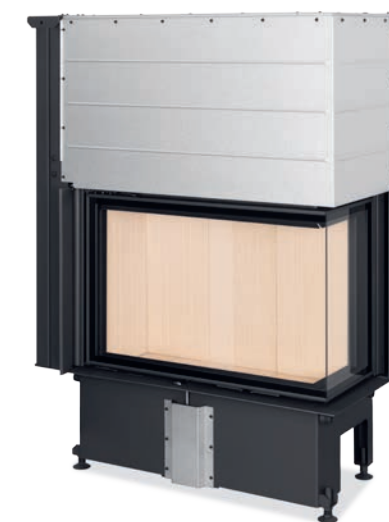
Impression R 2G L 83.60.34.21

P R 6,2–16,1 kW % 81,1 % Ø 200 mm ▣ 601 × 906 × 412 mm