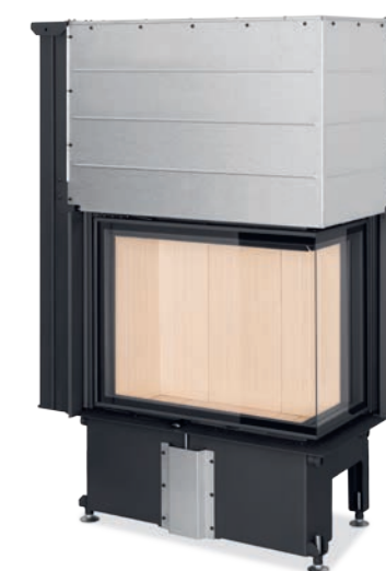
Impression R 2G L 71.60.34.21

P R 5,0–13,0 kW % 81,0 % Ø 200 mm ▣ 601 × 781 × 412 mm