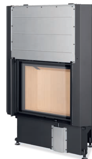
Impression 2G L 67.60.01