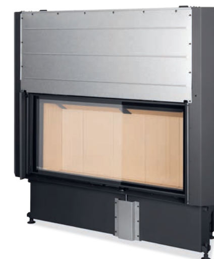
Impression 2G L 118.60.01