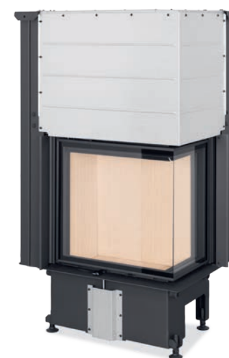
Impression R 2G L 58.60.34.21

P R 3,7–9,6 kW % 81,6 % Ø 180 mm ▣ 601 × 656 × 412 mm