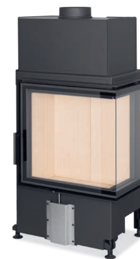
Impression R 2G S 58.60.34.21