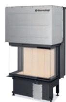
Impression C 2G L 8061.34.21